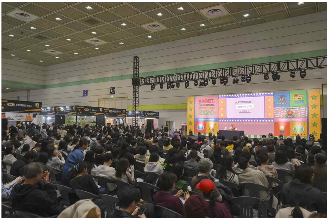
2025서울국제불교박람회 현장스케치 특설무대 담마토크