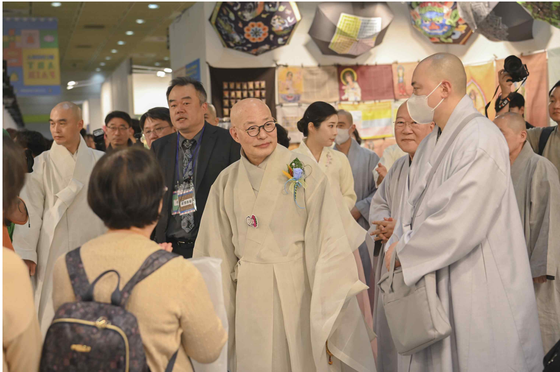
2025서울국제불교박람회 현장스케치 개막식 라운딩