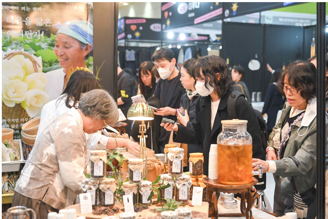
2025서울국제불교박람회 현장스케치 전시장 내부